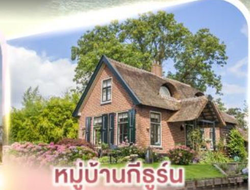
หมู่บ้านกีร์รูน