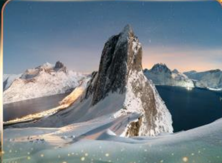
เกาะเซนญา