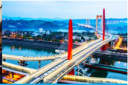
เมืองหยิซาง

วันที่ห้า เมืองจางเจี๋ย- เลือกซื้อโปรแกรมทัวร์เสริม OPTIONAL TOUR - ร้านหยก-ร้านใบชา-เมืองหยิซาง