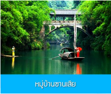
หมู่บ้านชาวลี