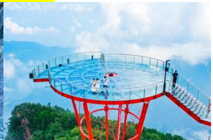
ระเบียงชมวิว Sky Eye