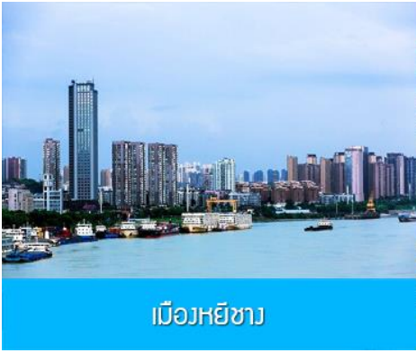
เมืองหยี่ชาง