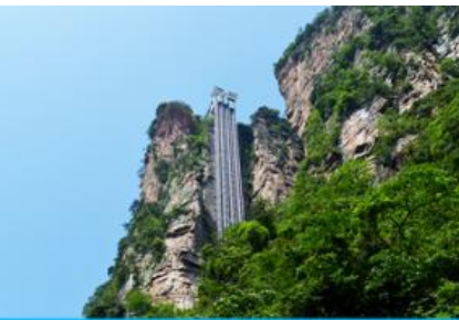
ลิฟท์แก้วไปหลว