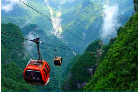
เขาเจ็ดดาว

เที่ยง รับประทานอาหารกลางวัน ณ ภัตตาคาร *บุฟเฟ่ต์หมูย่างเกาหลี (8)