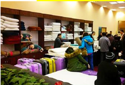
ศูนย์จำหน่ายผลิตภัณฑ์ยาวพารา