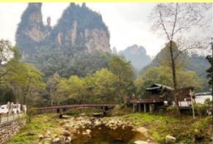
จุดชมวิวจีนเปียนซี

หลังอาหารให้ท่านพักผ่อนตามอัธยาศัยในโรงแรม หรือ ท่านสามารถเลือกซื้อโปรแกรมเสริม OPTIONAL TOUR ซึ่งเป็น โปรแกรมท่องเที่ยวที่ไม่ได้รวมอยู่ในรายการท่องเที่ยว ได้แก่