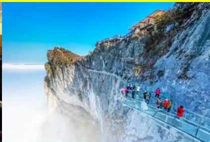
ระเบียงทางเดินกระจกเลียบนหน้าผา