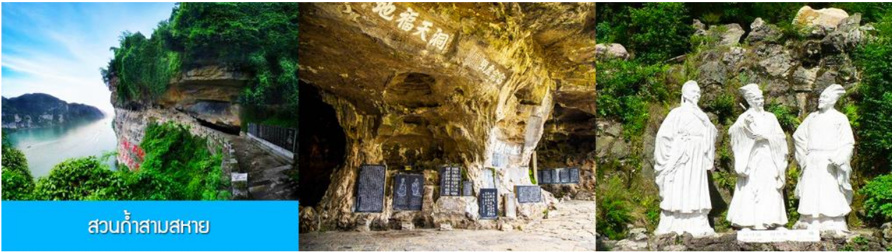
สวนกำสาบสหาย