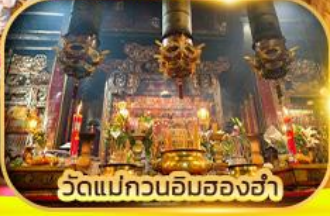
วัดแม่กวนอิมสองห้า