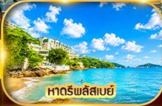
หาดริพลีสเบย์