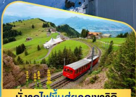
นั่งรถไฟขึ้นสู่ยอดเขาโรทิก