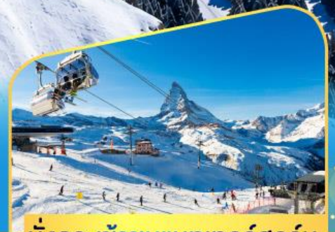
นั่งกระเช้าชมแมทเทอร์ฮอร์น