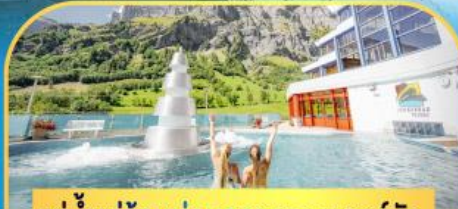
แช่น้ำแร่ร้อนผ่อนคลายลวยคอร์บิค