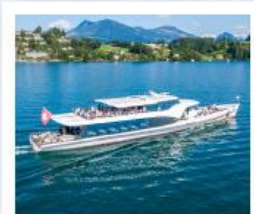
ล่องเรือทะเลสาบลูซิิร์น