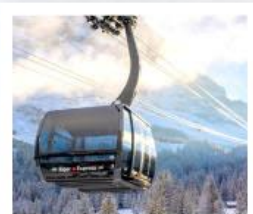
ขึ้นกระเช้ายอดเขาจุงเฟรา