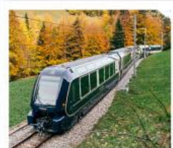
รถไฟโกลด์นพาส