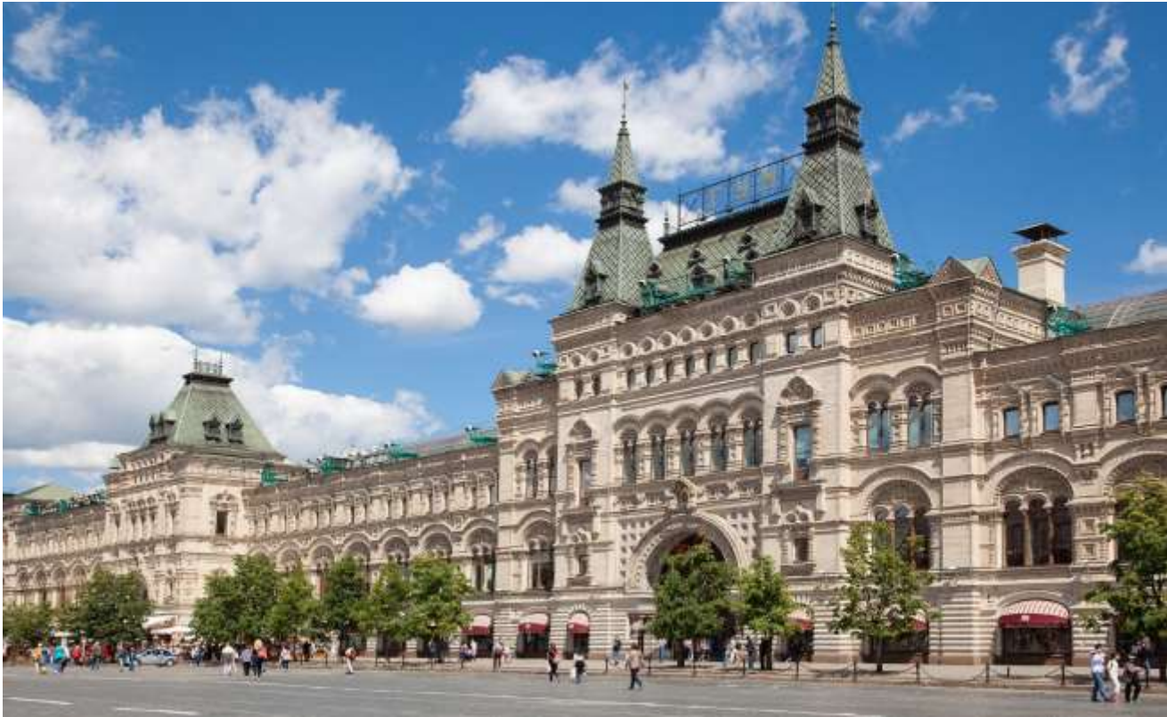
GUM DEPARTMENT STORE

เอกลักษณ์นี้ถูกสร้างขึ้นเพื่อเฉลิมฉลองชัยชนะอันยิ่งใหญ่ของรัสเซีย และยังคงตราตรึงในความทรงจำของผู้มาเยือนจากทั่วโลก ให้ท่านได้ข้อปึง “ ห้างสรรพสินค้ากุ่ม ” (GUM Department Store) ห้างสรรพสินค้าหรูหราเก่าแก่และใหญ่ที่สุดแห่งหนึ่งของกรุงมอสโก ตั้งอยู่ริมจัตุรัสแดง ตัวอาคารมีความงดงามด้วยสถาปัตยกรรมสไตล์นีโอคลาสสิกอันเป็นเอกลักษณ์ ภายในเต็มไปด้วยร้านค้าแบรนด์เนมระดับ