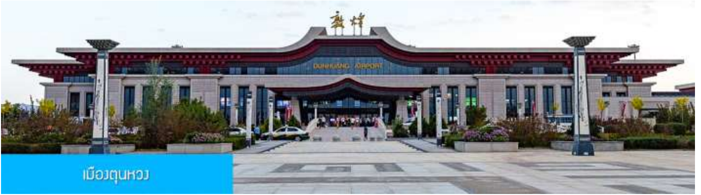
เมืองตุนหวง