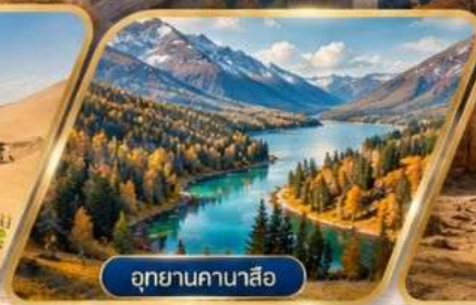
อุทยานคานาสีอ