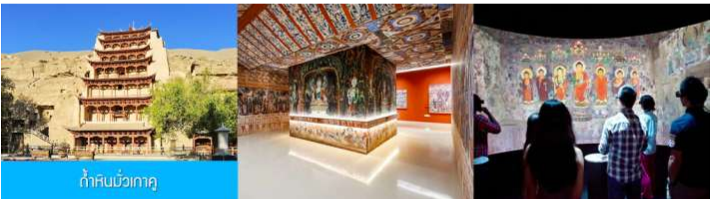
ถ้ำหินมั่วเกา

เช้า รับประทานอาหารเช้า ณ ห้องอาหารของโรงแรม (1)