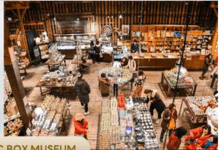
OTARU MUSIC BOX MUSEUM