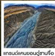
แกรนด์แคนยอนตู้ซานจื่อ