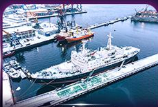
เรือตัดน้ำแข็งเลนิน