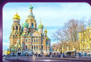
โบสถ์แห่งหยดเลือด