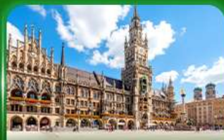
จัตุรัสมาเรียนพลัทซ์ มิวนิก