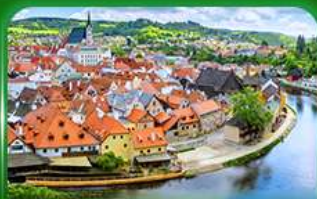
เมืองมรดกโลก เซสท์ครุมลอฟ