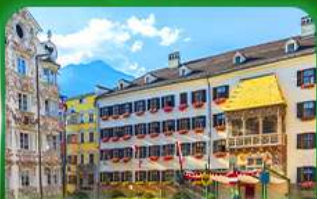
หลังคาทองคำ อินส์บรุค