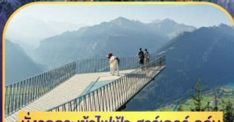
นั่งรถกระเช้าไฟฟ้า ฮาร์เตอร์ คูลัม