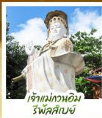
เจ้าแม่กวออิ้ม รพีลัสเบย์