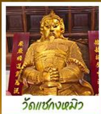
วัดเข่งงเดมิว