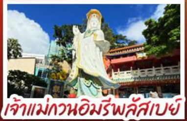
เจ้าแม่กวนอิมรัฟัสเบย์