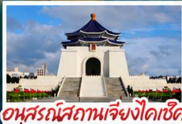
อุทยานเสถียรเจียงไคเช็ค