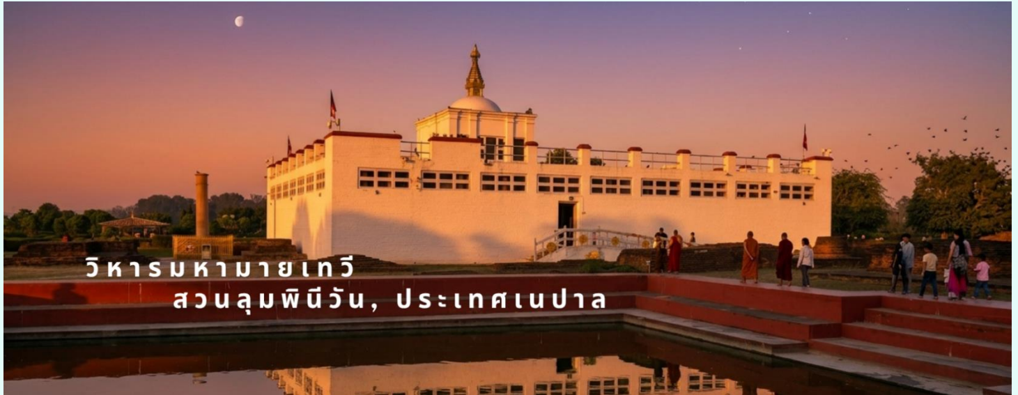
วิหารมหายเทวี สวนลุมพินีวัน, ประเทศเนปาล

กล้องวีดีโอ 10 USD / 800 รูปีอินเดีย / 400 บาท