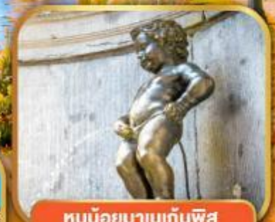
ทูน้อยมาบเก้นพีส