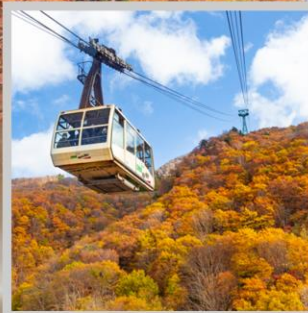
“ZAO CHUO ROPEWAY”