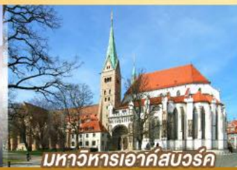
มหาวิหารเอาก์สเวิร์ค