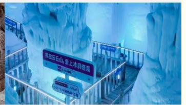
ถ้ำน้ำแข็งอวี่นชีวซาน

*ทางบริษัทฯ ขอสงวนสิทธิ์ในการสลับโปรแกรมทัวร์ตามความเหมาะสมขึ้นอยู่กับสถานการณ์หน้างาน โดยคำนึงถึงผลประโยชน์ของลูกค้าเป็นสำคัญ