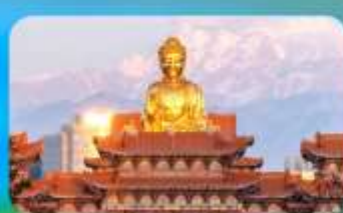
วัดพระใหญ่หวงกงชาน