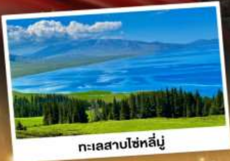
ทะเลสาบไซท์ลี่นู่

ชมวิวดอกคังการแบบยุโรปผสมเอเชีย กุ๋นหนานาเขียวดำ ทะเลสาบสีเทอร์ควอยซ์