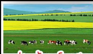
ทุ่งหญ้าเออร์ดอส

ทุ่งหญ้าเออร์ดอส สุสานเจกิสข่าน แกรนด์แคนยอนแม่น้ำเหลือง