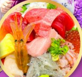
ตลาดปลาชิโมะ คาชิมะ-อิจิ