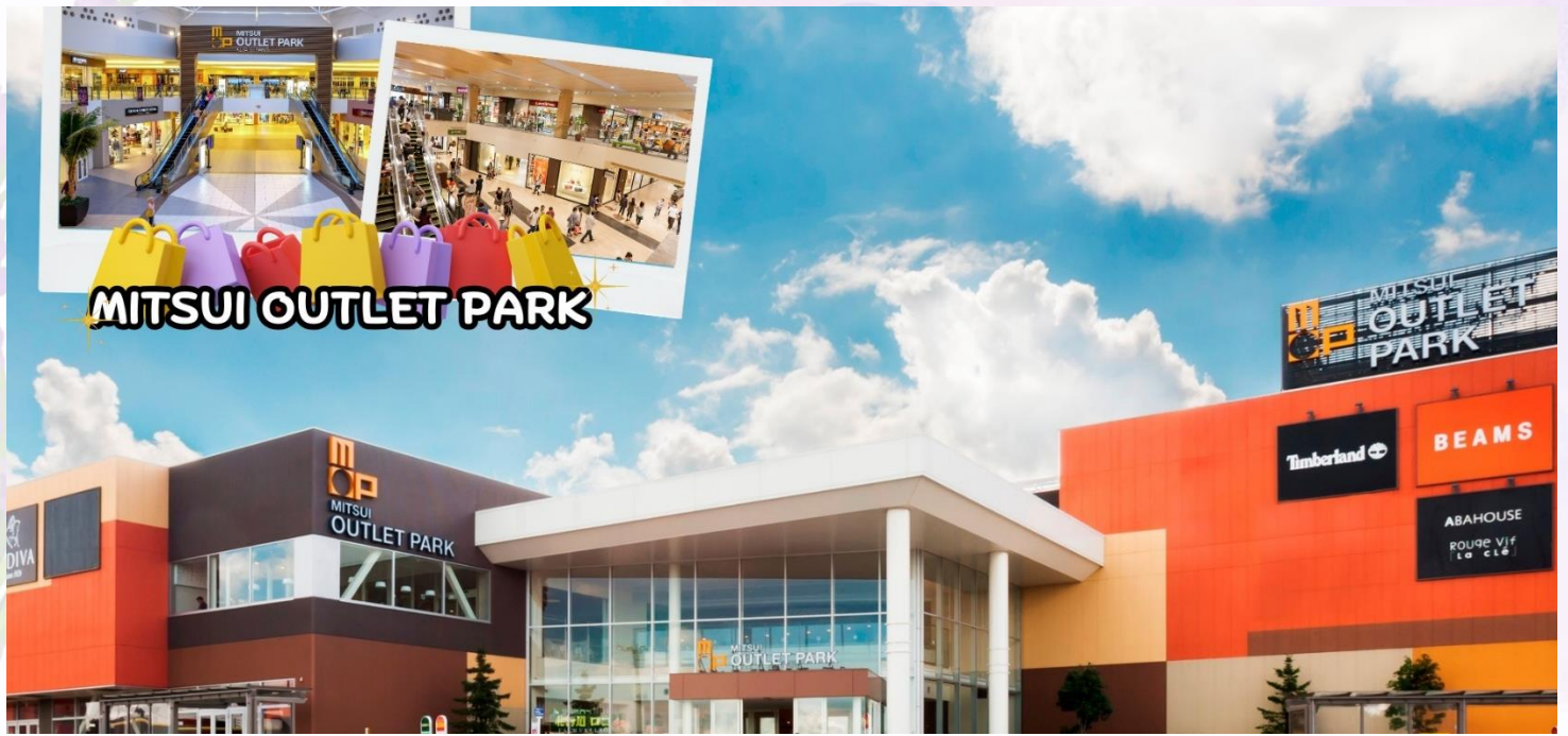
กลางวัน อีสรระอาหารกลางวันตามอัยาศัย ณ MITSUI OUTLET PARK SAPPORO