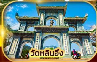
วัดหลินฮั่ง