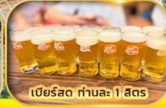
เบียร์สด ท่านละ 1 ลิตร