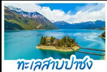
ทะเลสาบปาซง

รถไฟสายหลังคาโลก พระราชวังโปตาลา วัดโจคัง - ทะเลสาบปาซง พระราชวังฤดูร้อนแอร์มูลิงคา