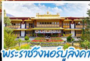
พระราชวังนอร์มูลิงคา