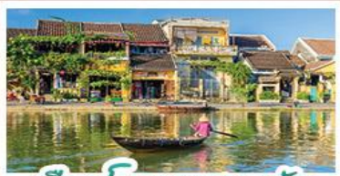
เมืองโบราณเฮงฮัน

! พักบานาน่าฮิลล์ 1 คืน ! สัมผัสอากาศเย็นตลอดปี สตรีฟรังเศสสุดคลาสสิก - นั่งกระเช้ายาวที่สุด สู่อานาฮิลล์ สนุกสุดมันส์ไปกับสวนสนุก The Fantasy Park มีบริการเช่าแม่กวนอิมองค์ใหญ่ที่สุดของเมืองดานัง - เชื้ออินเมืองมรดกโลกฮอยอัน - สนุกสนานไปกับกิจกรรม!!นั่งเรือกระดิง หมู่บ้านกัมทาน เชื่อกันร้านกาแฟ SON TRA MARINA CAFE - ไม่หลงร้านช้อปปิ้ง - อิ่มอร่อยกับบุฟเฟ่ต์นานาชาติ , หม้อไฟซีฟู้ด