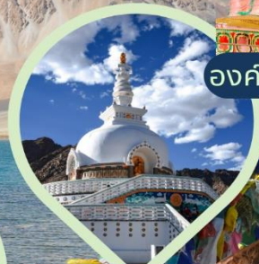
เจดีย์สันติภาพ