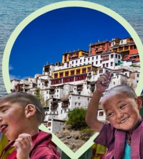
วัดธิเบตนิคายมหายาน หมวกแดง หมวกเหลือง