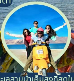
ทะเลสาบน้ำเค็มสูงที่สุดในโลก แปงกอง