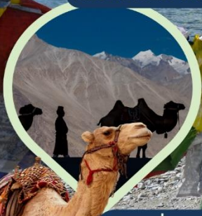
ซิลลี่ ซ็อซู่ ทะเลทราย กลางอ้อมกอดหิมาลัย