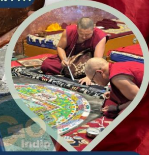
พระลามะ ผู้มีวัตรปฏิบัติ อันอัศจรรย์