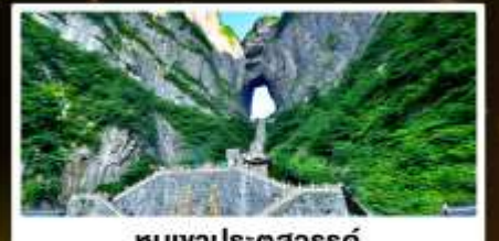
หมู่บ้านประตูสวรรค์