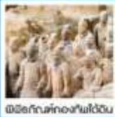
เมืองโบราณที่กองทัพได้ค้น