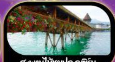
สะพานไม้ซาปค ลูซิริน