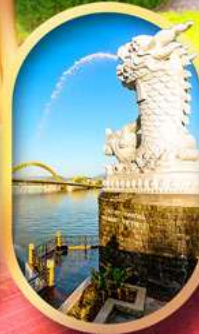
คาร์พดราท้อน