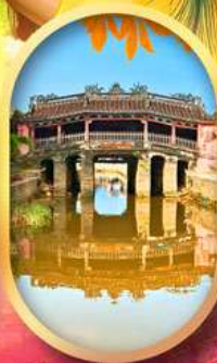
เมืองเก่าฮอยอัน