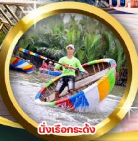
นั่งเรือกระดิ่ง