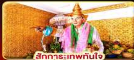
สิทธิการะเทพทันใจ