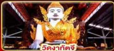
วัดงาทัดจี

สิทธิการะ 3 มหาบุชาสถาน พักบนอินทร์แวน 1 คืน