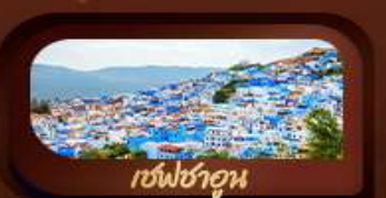
เชฟชาอูน