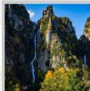
“GINGA & RYUSEI FALLS”

สัมผัสความสวยงามของดอกไม้ “ดอกทิวลิป ณ สวนคะมิยูเบตสึ” ที่มีมากกว่า 120 สายพันธุ์ เพลิดเพลินกับ “ถ้ำน้ำแข็งไอซ์ พาวีเลียน” ที่มีหยดน้ำแข็งรูปร่างสวยงามต่างๆ ที่อุณหภูมิ -20 องศา “ฟาร์มสุนัขจิ้งจอกฮอกไกโด” ฟาร์มสุนัขจิ้งจอกแห่งเดียวของเกาะฮอกไกโด สายพันธุ์ท้องถิ่นคือ สายพันธุ์ Ezo red fox ชมกระท่อมไม้หลังน้อยในดินแดนเทพนิยาย ณ “หมู่บ้านนิงเกิลเทอร์เรซ” จำหน่ายสินค้าจำพวกงานฝีมือต่างๆ นำท่านขึ้นชมวิวมุมสูง “นั่งกระเช้าภูเขาไฟโมอิวะ” เพื่อชมทัศนียภาพของเมืองซัปโปโรจากมุมสูง ชม “ทุ่งดอกพืชมอส ณ สวนทาคิโนะอุเอะ” ด้วยพรมสีเขียวที่มีพื้นที่ขนาดใหญ่ถึง 100,000 ตารางเมตร