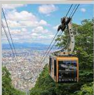
“MT. MOIWA ROPEWAY”