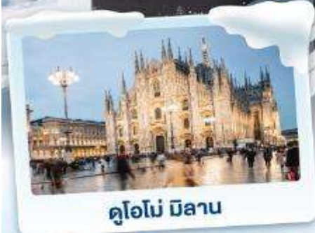
คูโอโม มิลาน