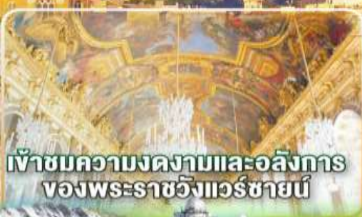
เข้าชมความงดงามและอลังการ ของพระราชวังแวร์ซายน์