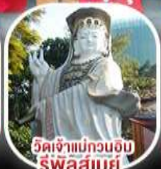
วัดเจ้าแม่กวนอิม รีพัลส์เบย์