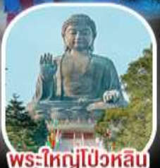
พระใหญ่ไผ่หวิน