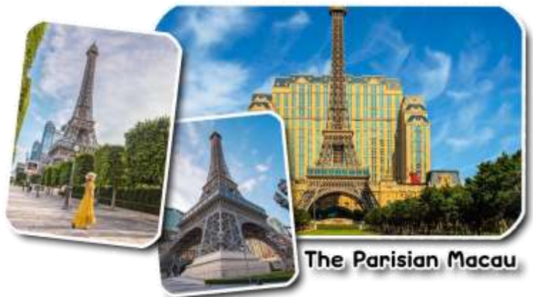
The Parisian Macau

และนำท่านชม The Parisian Macao (เดอะปารีสเซียน มาเก๊า) เป็นอีกหนึ่งแลนด์มาร์คของมาเก๊าที่ได้ยกหอไอเฟลมาจำลองใจกลางเมือง Cotai Strip โรงแรมแห่งนี้ได้รับแรงบันดาลใจมาจากเมืองปารีส ประเทศฝรั่งเศส นครแห่งศิลปะที่มีความงดงามทางด้านสถาปัตยกรรม ความโดดเด่นของหอไอเฟลกลิ่นอายของความคลาสสิกและความโรแมนติกมาไว้ที่โรงแรมแห่งนี้