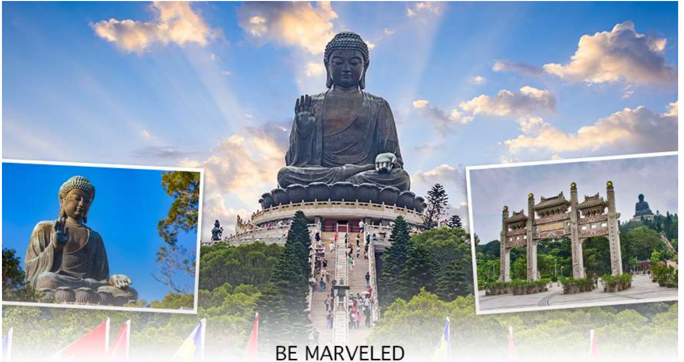
BE MARVELED พระใหญ่เทียนถาน

☉อิสรอาหารเย็น เพื่อความสะดวกในการขอปิ้ง