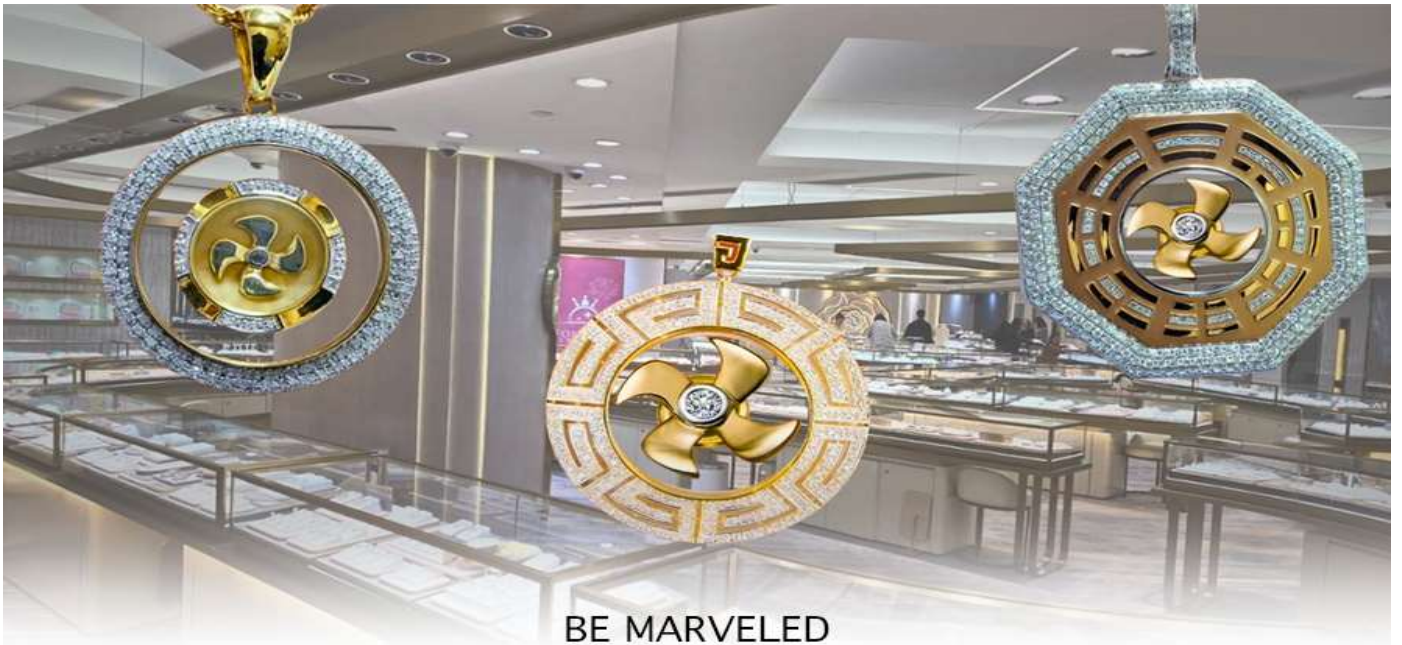
BE MARVELED ศูนย์ฮวงจุ้ย กัมพันนครบุรี

ความเชื่อว่าหยก มงคล ถ้าพกติดตัวไว้จะอายุยืนและสุขภาพดีมีสินค้ามากมายเกี่ยวกับหยก อาทิ กำไลหยก หรือสัตว์นำโชค อย่างปี่เซี่ยะ ให้ท่านได้เลือกซื้อเป็นของฝาก, ของที่ระลึก หรือของนำโชคแต่ตัวท่านเอง