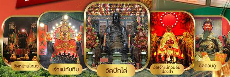
วัดหม่ามโหมว