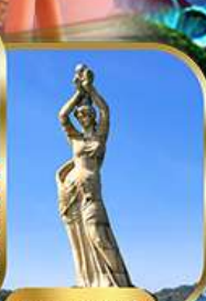
จูไห่ฟิชเชอร์เก็ส