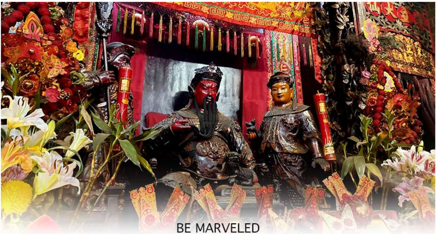
BE MARVELED วัดกวนอู

เจ้าแม่ทับทิม หรือ เทพธิดาแห่งท้องทะเล ซึ่งทำหน้าที่ปกป้องคุ้มครองชาวประมง ตั้งโดดเด่นอยู่ท่ามกลางสวนสวยที่ทอดยาวลงสู่ชายหาดให้ท่านนมัสการขอ และนำท่านเดินข้าม สะพานต่ออายุ ซึ่งเชื่อกันว่าข้ามหนึ่งครั้งจะมีอายุเพิ่มขึ้น 3 ถ้าข้ามแล้วห้ามเดินย้อนกลับไปเด็ดขาด เพราะคนฮ่องกงเชื่อว่าชีวิตจะสั้นลงไป 3 ปี สำหรับคนโสดจะนิยมขอพรกับ เทพเจ้าแห่งความรัก ให้เอามือลูบที่บริเวณหินสีดำ พร้อมกับอธิษฐานให้สมหวังกับความรัก ปิดท้ายด้วยการรับพลังฮวงจุ้ยจาก ศาลา แปรทิศ ซึ่งถือเป็นจุดรวมรับพลัง ถือเป็นจุดที่มีฮวงจุ้ยดีที่สุดในเกาะฮ่องกง และยังมีรูปปั้นองค์เทพอีกมากมายภายในวัดแห่งนี้ให้กราบไหว้ขอพร