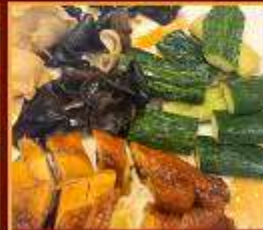
ไก่ แดงกวา เห็ดหูหนู