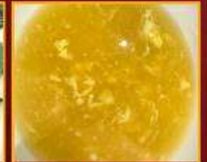
ซุ๊ปข้าวโพด