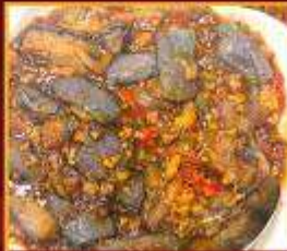
มะเขืออบหม้อดิน