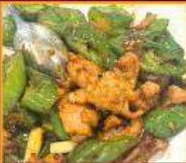
หมูผัดพริกหยวก