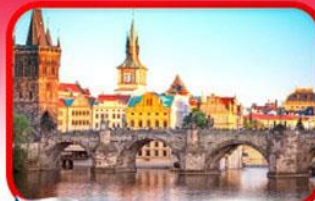
เขื่อนอินสพานชาร์ลส์