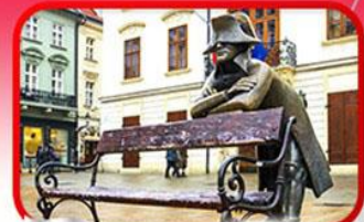
ย่านเมืองเก่าราติสลาวา

เที่ยวเมืองสวยริมทะเลสาบ ฮัลล์สตัดท์ • ชมเมืองไข่มุกแห่งโบฮีเมีย เซสกี กรุงลอน • ปราก • เวียนนา • ซอปปิงพาร์นดอร์ฟ เอาก์เล็ท