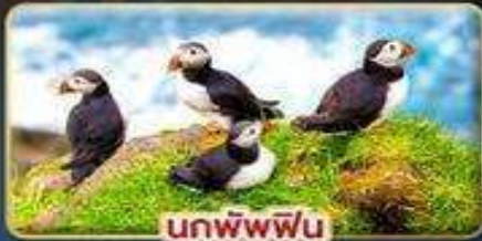
นกพิฟฟิน

📅 เดินทาง : 30 เม.ย. - 07 พ.ค. | 23-30 ก.ค. 69