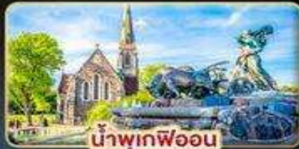
น้ำพุเทพออน