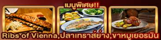
Ribs of Vienna, ปลาเทราสย่าง, ฆาตกรรมเยอรมัน

Zugspitze Munich Salzburg Hallstatt Bratislava