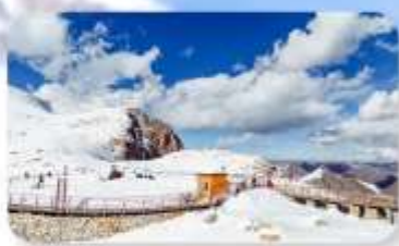
อุทยานคำกู่ปิงชวน