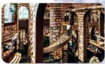
ร้านหนังสือจงซูเก๋อ